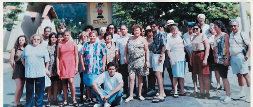
Viagem para Caldas Novas, em Goiás, promovida pelo diretor, na Astaptel

Hoje, com 78 anos, sente-se muito grato por tudo. “Aposentei com 55 anos na época da privatização e tenho uma grande saudade de tudo e de todos”, comentou.