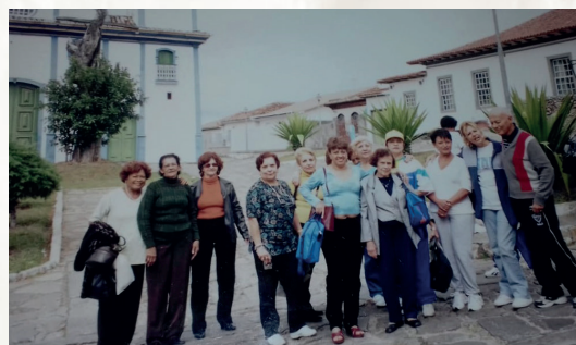
Viagem com os associados da Astaptel para a cidade de Diamantina/MG