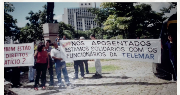
Manifestação na Praça Milton Campos, em apoio aos empregados da Telemar