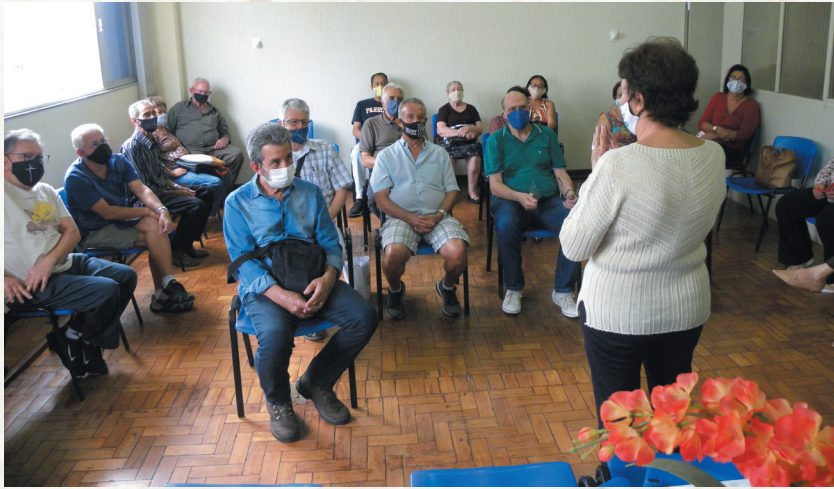
Associados, na sede da Astaptel, no dia da votação para nova diretoria da Instituição

No dia 22 de outubro de 2020, foi realizada a eleição para nova diretoria executiva da Astaptel para o biênio 2020-2022.