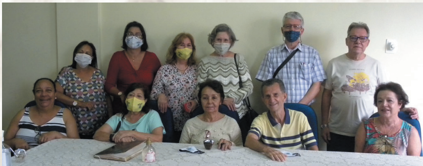
Esta é a 13ª diretoria que estará à frente da Astaptel. Eleita para o biênio 2020-2022