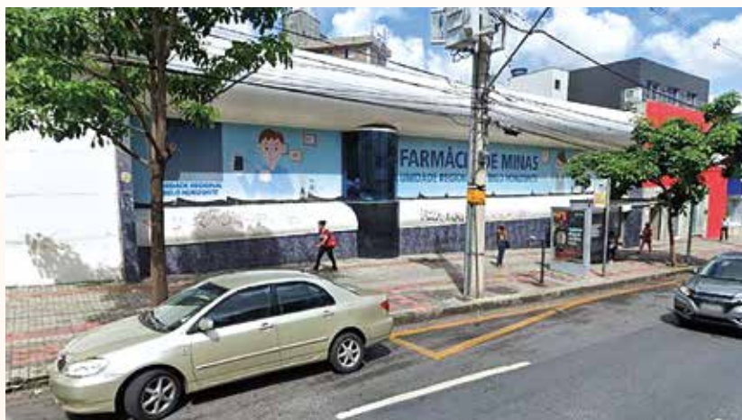
Por meio da Farmácia de Minas usuários têm acesso a medicamentos e insumos de forma gratuita

A gestão é feita pela Secretaria de Estado de Saúde de Minas Gerais (SES-MG) e segundo o órgão, a Unidade regional de Belo Horizonte, atende cerca de 50 mil usuários mensalmente tanto da região de Belo Horizon-