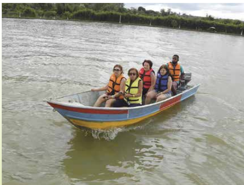
Hotel Fazenda Lagoa Azul, em Esmeraldas/MG

No segundo semestre de 2021, a Associação retomou, gradativamente, as atividades de convivência e entretenimento para os associados. Em outubro e dezembro, foram feitos dois passeios em locais abertos,