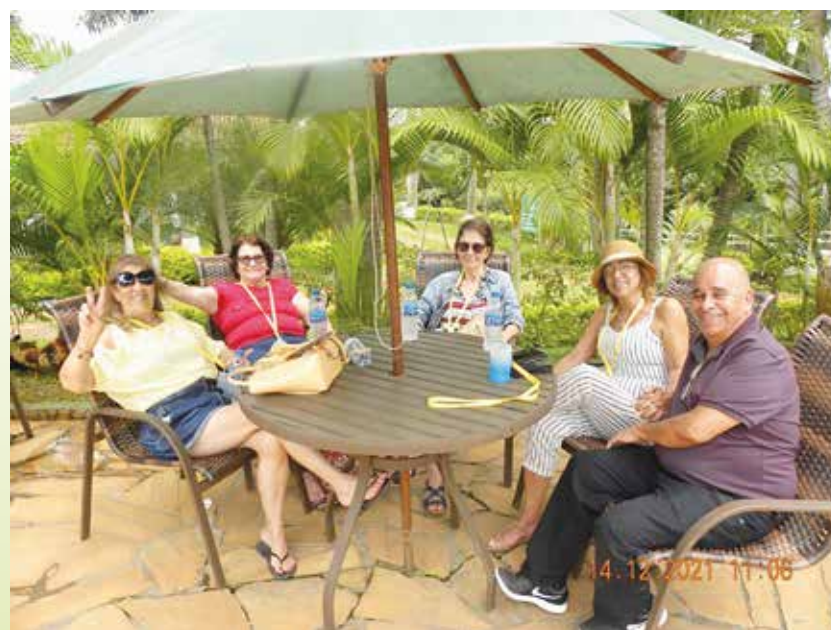
Hotel Fazenda Vale do Amanhecer, em Igarapé/MG

No segundo semestre de 2021, a Associação retomou, gradativamente, as atividades de convivência e entretenimento para os associados. Em outubro e dezembro, foram feitos dois passeios em locais abertos,